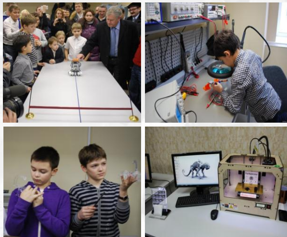
ОТКРЫТИЕ ЦМИТ В ТЕХНОПАРКЕ «ИДЕЯ» 27.02.2013 г.